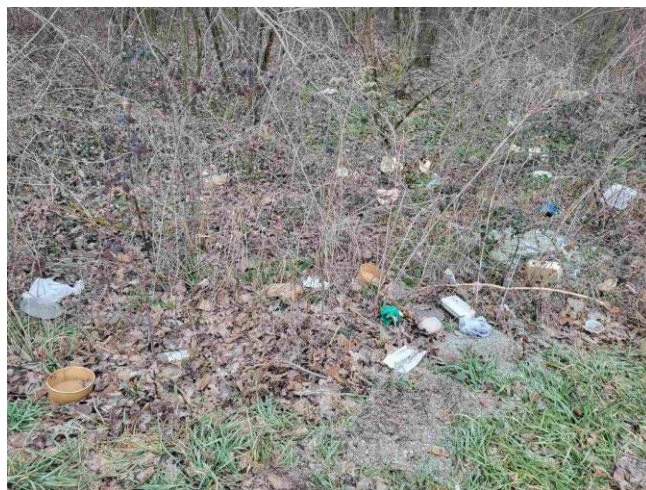
3. Nelegalno odlagalište – cesta između Čičkovine i Zamlake, cca 1m 3