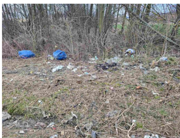
4. Nelegalno odlagalište – cesta prema Gabrinovcu, cca 2m 3